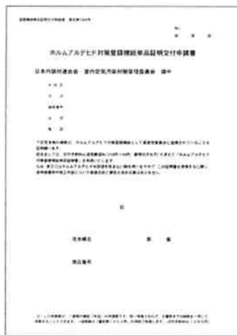
单品証明交付申請書