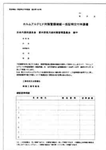
一括証明交付申請書